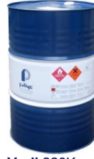
Varil 220Kg Barrel 220Kg (R.60cmx88cm)