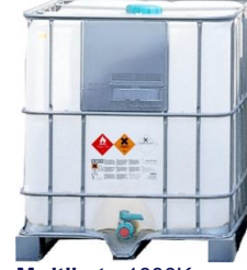
Multikutu 1000Kg Multicontainer 1000Kg (120cmx100cmx116cm)